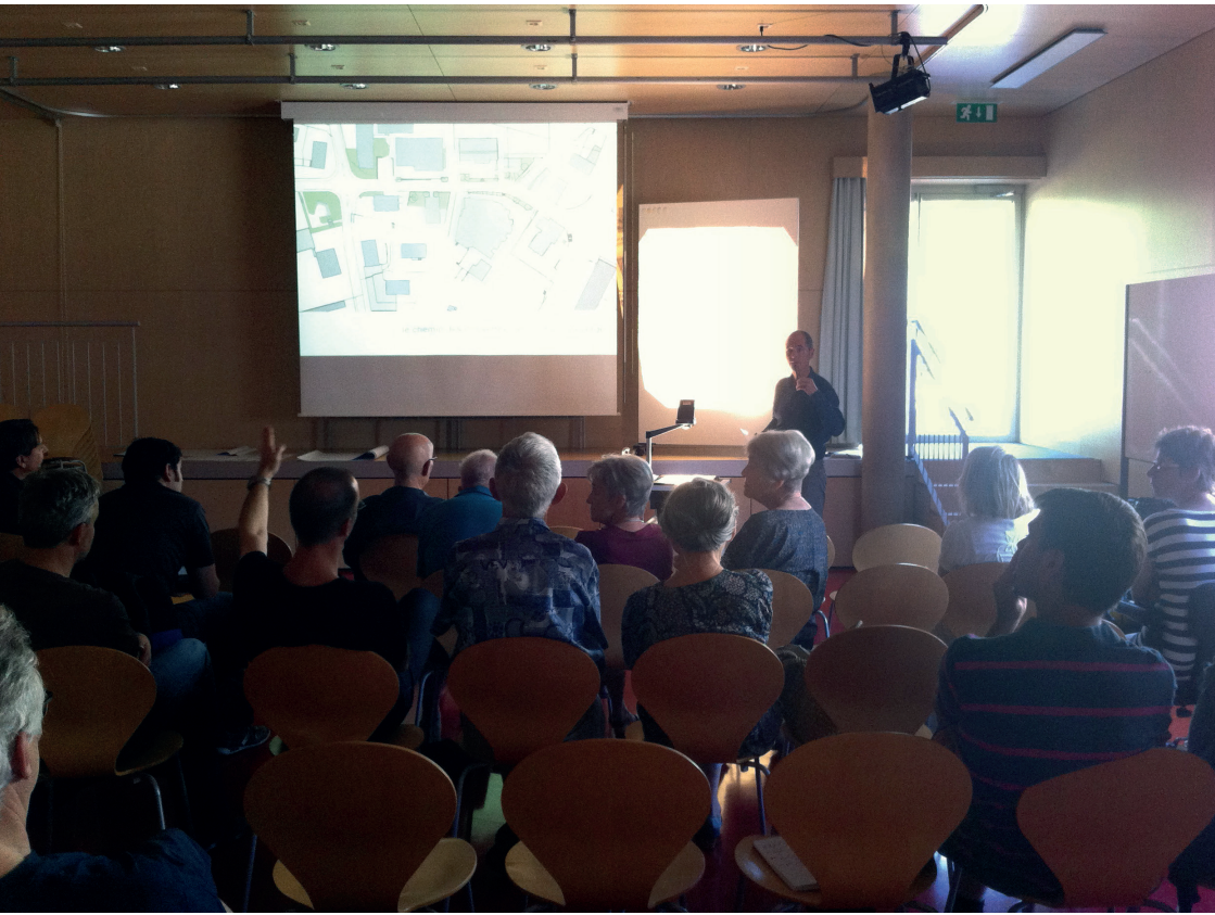
photo : présentation du projet de paysage - 21/06/14