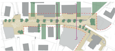
Coupes sur les aménagements pour la place du chemin des Croisettes