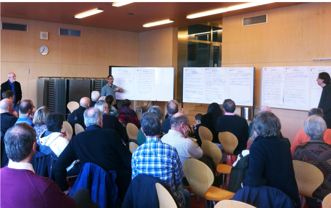
photo : présentation du travail en groupe Atelier 1 - 25/01/14