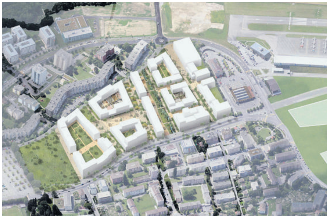
Le concours d'investisseurs concerne une partie du futur quartier des Plaines-du-Loup, dans les hauts de Lausanne. L'endroit est occupé aujourd'hui par des installations sportives.

«Pour ce qui est des types de logements, on aura comme pour les autres projets lausannois la règle des trois tiers», continue l'élu